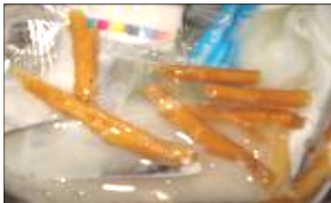
PUR-Klebstoffreste (ausgehärtet) wurden rechtzeitig aus dem Schlauch gespült.

mit voller Herstellergarantie und werden zufrieden sein.